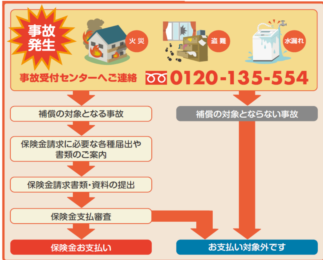
【保険金のお支払いに必要な書類（例）】